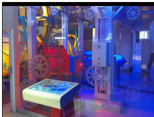
Ausstellung "Maschinarium" an der Bergstation