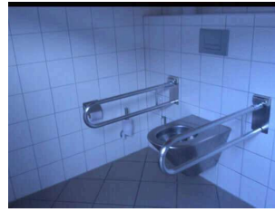
Toilette am Parkplatz Talstation "Obstfelderschmiede"