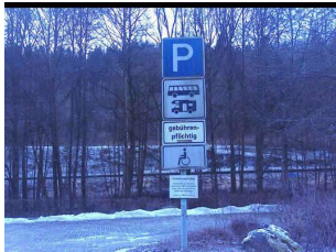
Parkplatz Talstation "Obstfelderschmiede"