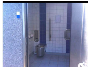
WC an der Bergstation