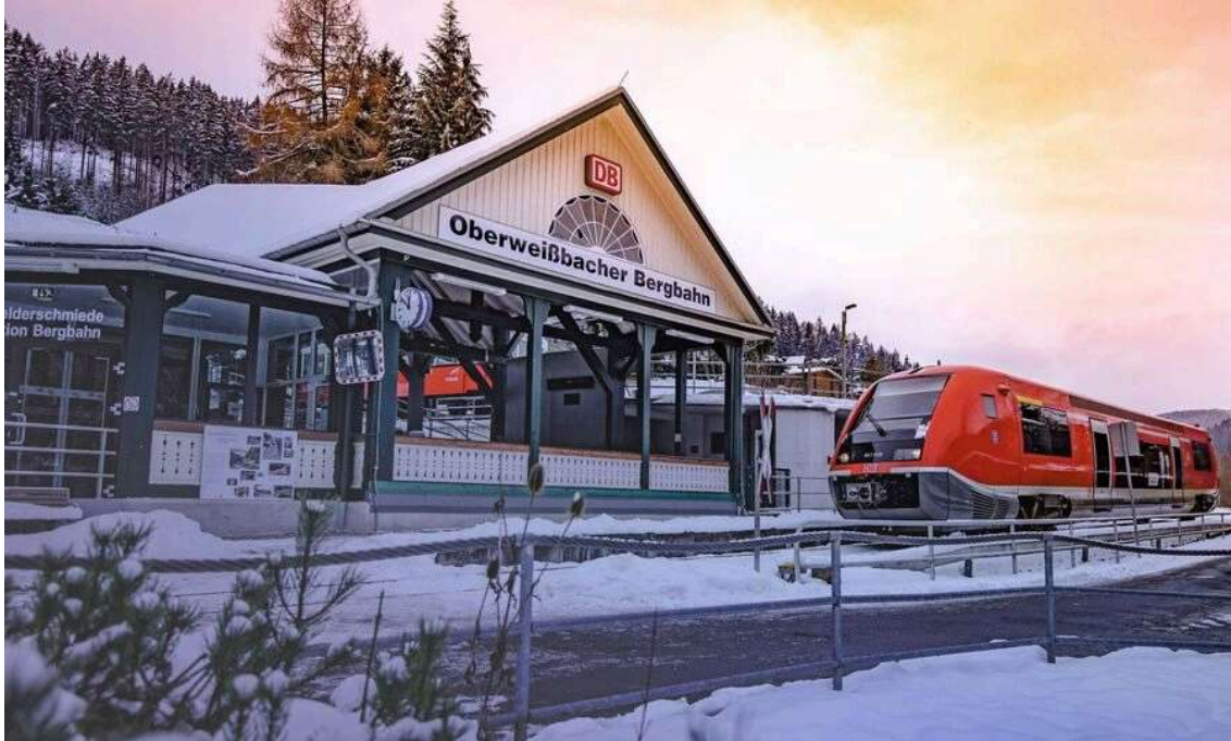
Talstation von Thüringer Bergbahn – Oberweißbach