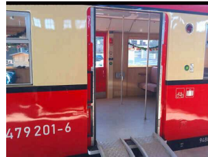
Einstieg in die Kabine – Flachstrecke Richtung Cursdorf